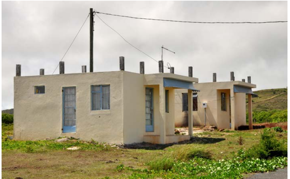
Beaucoup de familles n'ont pas un toit approprié. La Rodrigues Housing and Property Development Company construira des maisons pour les familles qui n'ont pas accès aux emprunts des banques...

L'année dernière, 350 personnes ont bénéficié d'un logement sous le « Low Cost housing », 160 ont pu avoir une maison où la Commission a fourni les matériaux et ils ont eux-mêmes construit la maison. Cette année encore, la Commission continue, voir même, double ses efforts pour à venir en aide