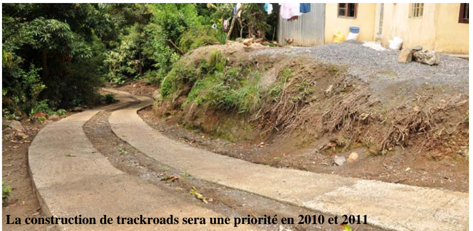
La construction de trackroads sera une priorité en 2010 et 2011

aux plus nécessiteux. Il faut dire que le partenariat entre la Commission des Infrastructures Publiques et la Sécurité sociale à travers la Rodrigues Housing Committee aide énormément à l'identification des plus vulnérables. En effet, dans le budget quelque Rs 40 M a été prévu pour des projets de logement.